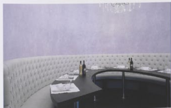
Sopra, la sala principale. A fianco, la saletta con divano in pelle e tavolo di forma ellittica.